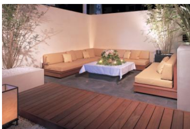
プライベートソファテラス席:1席

テラス席には珍しい堀ごたつ座席。しっとり落ち着いた雰囲気は大人が楽しむテラス席です。:全12席