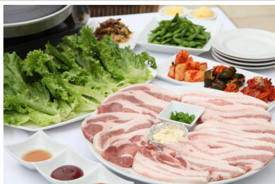
枝豆・8種ナムル・3種キムチ盛り合わせ・和豚もち豚盛り合わせ・葉物野菜・ジェラートの6品