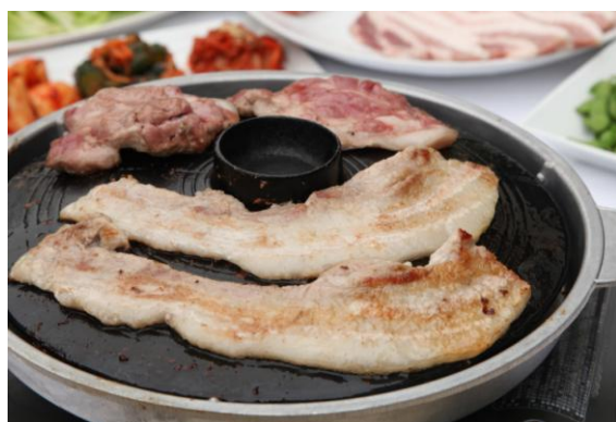
和豚もち豚は濃厚な肉の旨味たっぷりのバラ肉と、脂肪少なめであっさりなロースをご用意。味の違いをお楽しみください。

■サムギョプサル & フローズンマッコリ ■ お食事 6品 2時間飲み放題付き 4,500円！